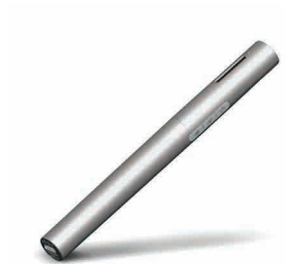
adolescents et adultes