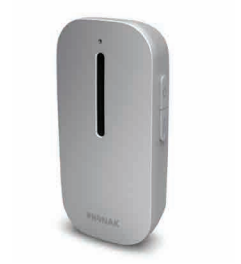
adolescents, adultes et parents d'enfants en bas âge